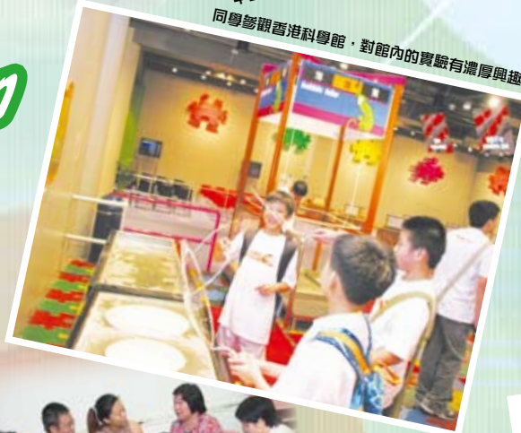
同學參觀香港科學館，對館內的實驗有濃厚興趣。