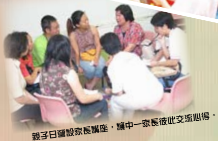
親子日營設家長講座，讓中一家長彼此交流心得。

「夏日新一Teen」中一新生暑期適應課程已於7月18日至29日舉行。本年度的中一新生，透過功課輔導、集體遊戲、問答比賽、外出參觀及親子日營，對新學校、新老師和新同學加深認識，度過一個開心快樂的暑假。