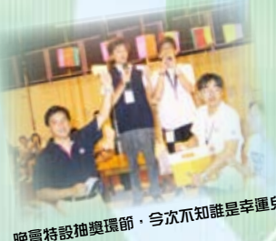
晚會特設抽獎環節，今次不知誰是幸運兒？