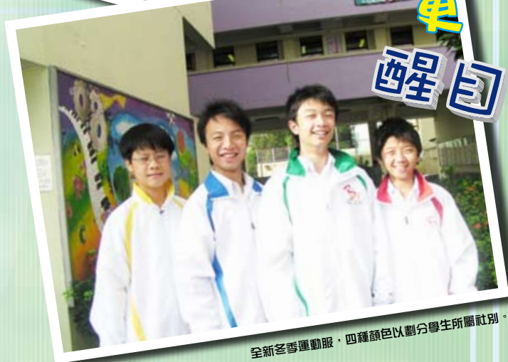
全新冬季運動服，四種顏色以劃分學生所屬社別。