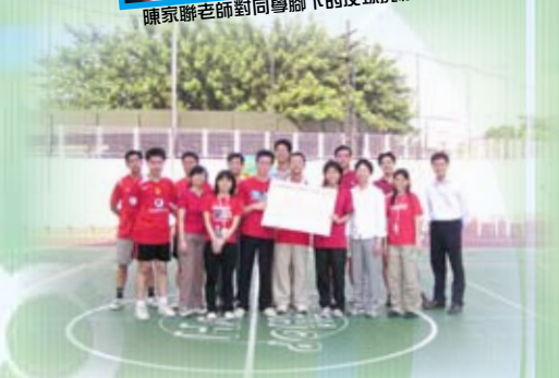
教師隊勝出，賽後來個大合照。

一年一度的師生足球賽已於9月28日舉行，本校學生代表隊與教師代表隊進行30分鐘的激烈賽事，教師隊終以3:0勝出。