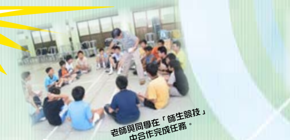
老師與同學在「師生競技」中合作完成任務。