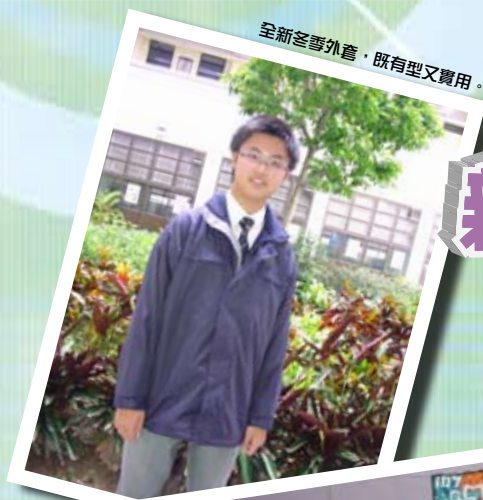
全新冬季外套，既有型又實用。

「夏日新一Teen」中一新生暑期適應課程已於7月18日至29日舉行。本年度的中一新生，透過功課輔導、集體遊戲、問答比賽、外出參觀及親子日營，對新學校、新老師和新同學加深認識，度過一個開心快樂的暑假。